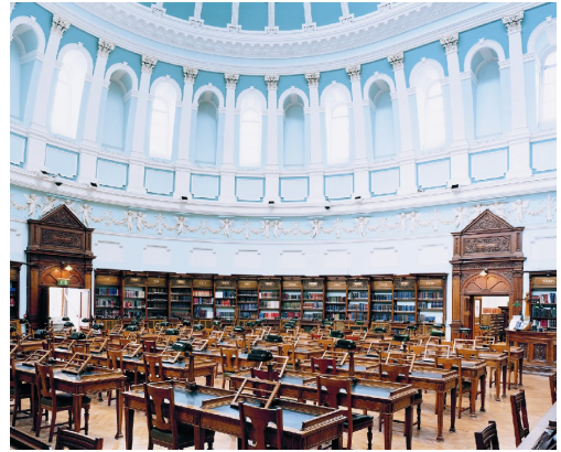
3) National Library of Ireland Dublin, 2004