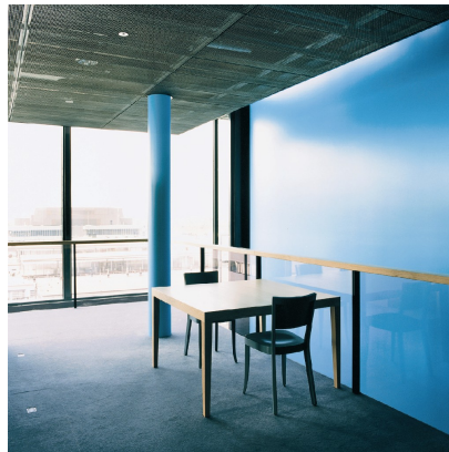
5) F. Hoffmann-La Roche AG, Basel, 2002