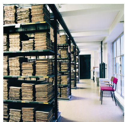
9) Sächsisches Staatsarchiv Dresden, 1999