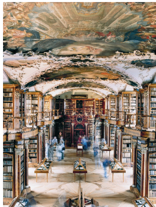
2) Stiftsbibliothek St. Gallen, 2001