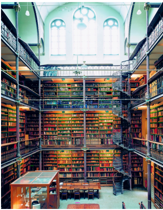
1) Rijksmuseum Amsterdam, 2004

Candida Höfer Bibliotheken Broschierte Sonderausgabe Mit einem Essay von Umberto Eco 272 Seiten, 137 Farbtafeln ISBN 978-3-8296-1003-2 € 36,- €(Ö) 37,10 CHF 41.40