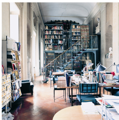
8) Villa Medici Roma, 2001