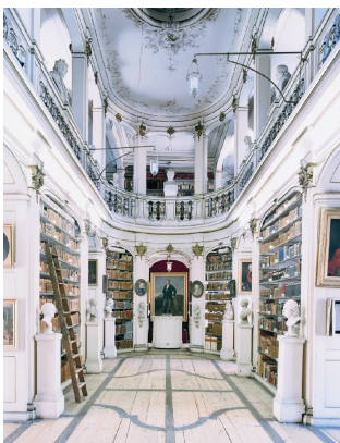
7) Herzogin Anna Amalia Bibliothek, Weimar, 2004