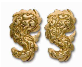
8 zwei goldene Schmuckplatten vom Dolchriemen mit Tierreliefs (Kat. Nr. 12)