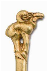
4 Schafsfigur des goldenen Stifts, Detail (Kat. Nr. 19)