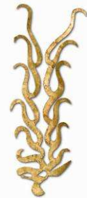
3 Zierbeschlag vom Bogen aus Goldblech in Form eines Hirschkopfes (Kat. Nr. 17)