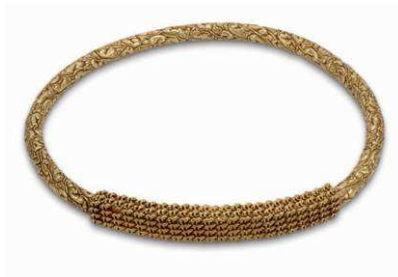
5 Halsring aus massivem Gold (Kat. Nr. 5)