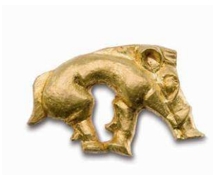
7 Goldenes Eberfigürchen vom Holzfutter des Köchers (Kat. Nr. 15)