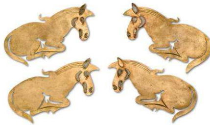
2 Pferdefiguren aus Goldblech mit Emaileinlagen (Kat. Nr. 4)