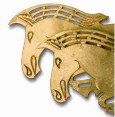
6 Pferdefiguren aus Goldblech von der Kopfbedeckung (Kat. Nr. 21)