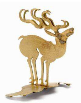
1 Hirschfigur aus Goldblech mit Email- einlagen, Bekrönung der Kopfbedeckung des Fürsten (Kat. Nr. 3)

Der Goldschatz von Arzan Ein Fürstengrab der Skythenzeit in der südsibirischen Steppe Konstantin Cugunov, Hermann Parzinger, Anatoli Nagler 144 Seiten, 78 Farbtafeln, 42 Abbildungen ISBN 3-8296-0260-X / 978-3-8296-0260-0 EUR 49,80 sFr 84,-