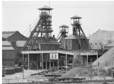
2) Puits Monceau Fontaine no 18, Charleroi, B 1967