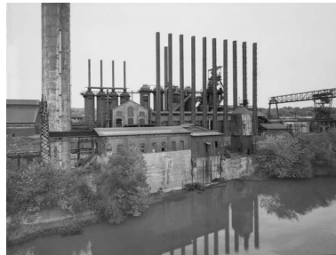
5) Youngstown, Ohio, USA 1980