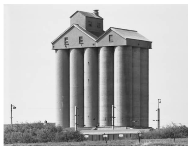
8) Amermont, Lorraine, F 1970