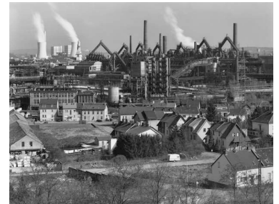
6) Völklingen, Saarland, D 2000