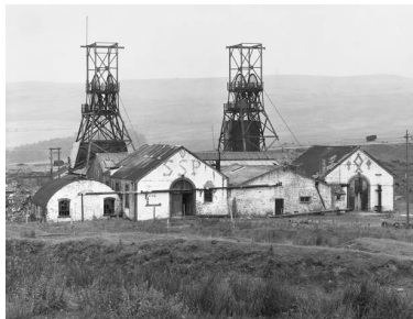
1) Seven Sisters Pit, South Wales, GB 1966