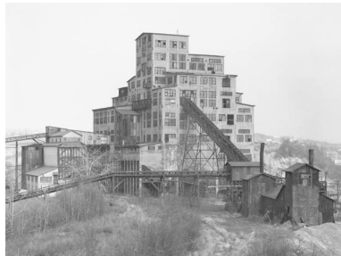
4) Moffat Breaker, Scranton, Pennsylvania, USA 1974