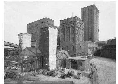
3) Zeche Hannover 1/2/5, Bochum-Hordel, Ruhrgebiet, D 1973