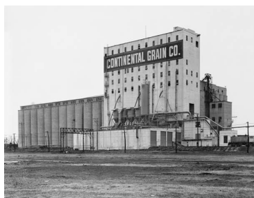
7) Milwaukee, Wisconsin, USA 1978