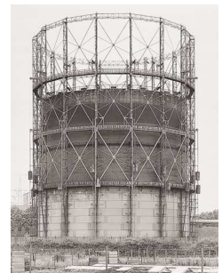
7) Alsdorf/Aachen, D 1965