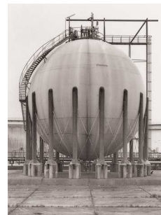
6) Wesseling/Köln, D 1983