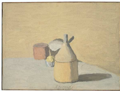
2) Stilleben, 1949