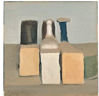
3) Stilleben, 1956