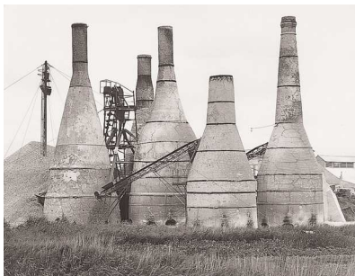
4) Harlingen, NL 1963