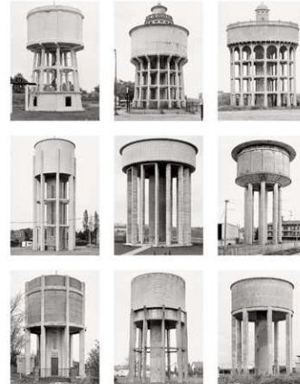
9) Wassertürme (Typologie), 1966-1986