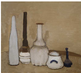
1) Stilleben, 1939