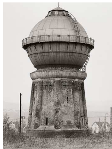
5) Wasserturm, Bebra D 1980