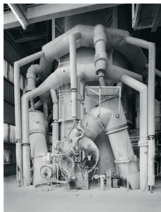
11) Saal, D 1999