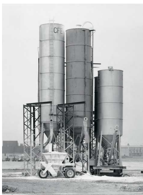
4) Rekingen, CH 2011