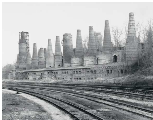
2) Rüdersdorf, D 1994