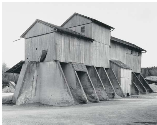
8) Oberbüren, St. Gallen, CH 2001