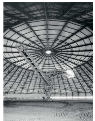
12) Rüdersdorf, D 1933