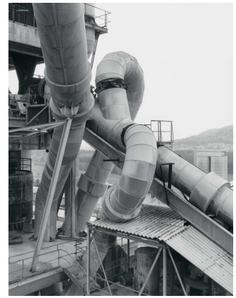
9) Neumarkt, D 1987