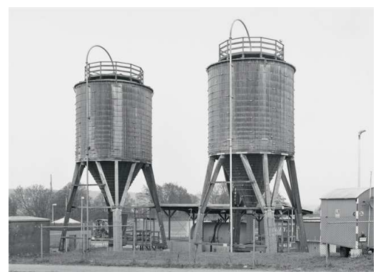
6) Pforzheim, D 2011