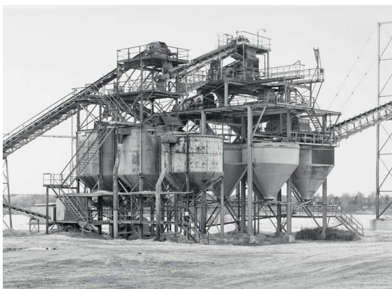
10) Rheintal/Köln, D 1989