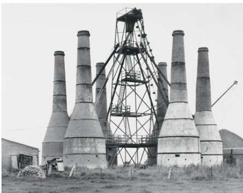
1) Harlingen, NL 1963

BERND & HILLA BECHER Steinwerke und Kalköfen 256 Seiten, 232 Duotone-Tafeln ISBN 978-3-8296-0576-2 €68.-, (A) €70.-, CHF 89.-