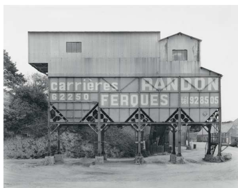
5) Ferques, F 1995