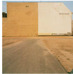
7) Schöneberger Straße, 1984 [vorher]