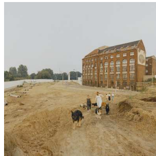
10) Görlitzer Ufer, 1990