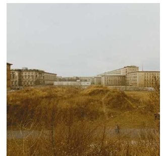
4) Trümmer des Prinz-Albrecht-Palais, 1988