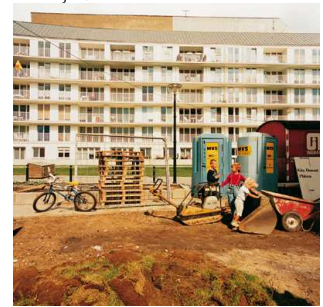
8) Schöneberger Straße, 1984 [nachher]