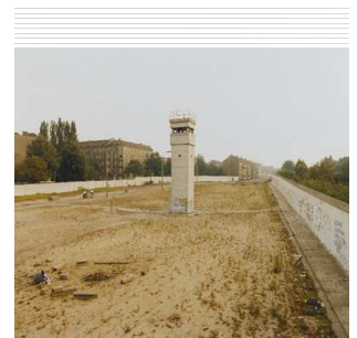
12) Lohmühleninsel, 1990