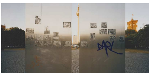
13) Karl-Liebnecht-Straße, 2003