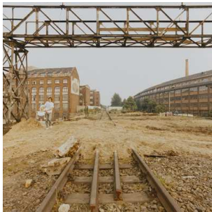
5) Görlitzer Ufer, 1990 [vorher]