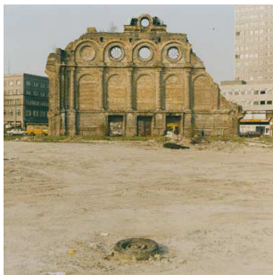
1) Anhalter Bahnhof, 1984

Giovanni Chiamonte Berlin, die Stadt, die immer wird Photographien 1984 - 2003 Mit Texten von Giovanni Chiamonte und Kurt W. Forster 160 Seiten, 66 Farbtafeln ISBN 978-3-8296-0410-9 Ladenpreis € 39,80; sFr 65,-