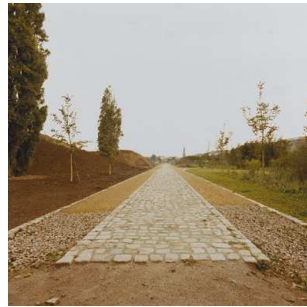
6) Görlitzer Ufer, 1990 [nachher]