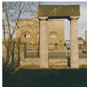
2) Friedrich-List-Ufer, 1984