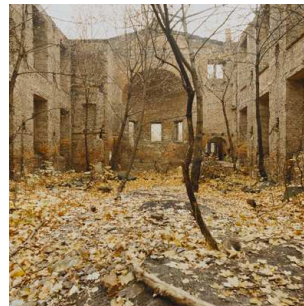
11) Elisabethkirche, 1990