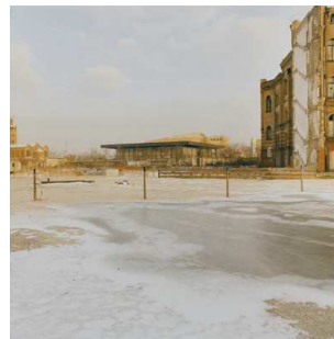
3) Hitzigallee, 1985