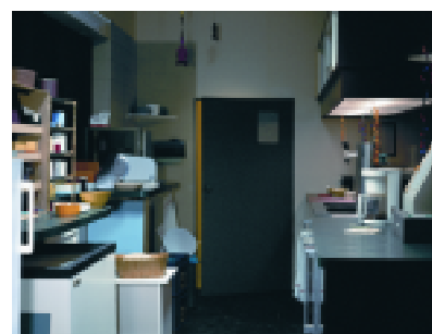
Klause/Tavern 3, 2006