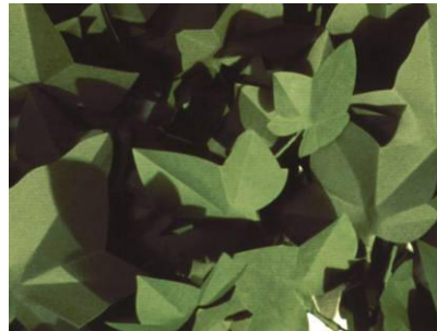
Ivy Wallpaper, 2006