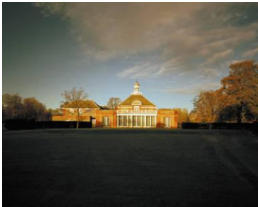
Serpentine Gallery, London

Thomas Demand Cuts, Papers and Leaves Katalog Serpentine Gallery London Englische Originalausgabe 144 Seiten, 33 Farbtafeln und 27 Abbildungen Format: 34 x 22 cm ISBN 3-8296-0249-9 / 978-3-8296-0249-5 Ladenpreis: € 59,- sFr 97,-