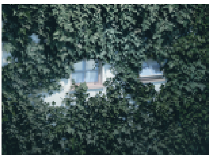
Klause/Tavern 2, 2006