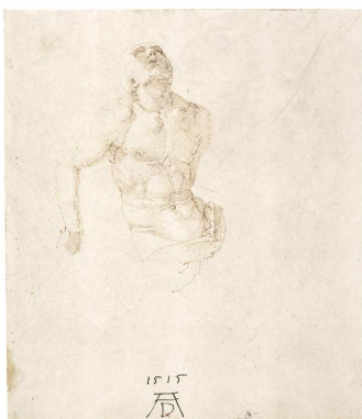
10) Studie zu einem Leichnam Christi, 1515 Federzeichnung, Albertina, Wien