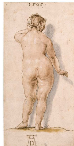
4) Eine korpulente nackte Frau, Rückenansicht ( Weiblicher Rückenakt ), 1505 Feder- und Pinselzeichnung, Louvre, Paris