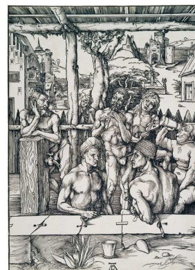
11) Das Männerbad, um 1496 Holzschnitt