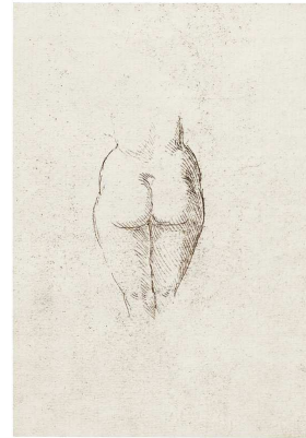
7) Weibliches Gesäß, um 1515 Federzeichnung, Dresdner Skizzenbuch/ SLUB Dresden, fol. 136r.