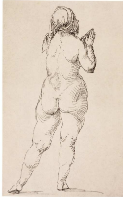
5) Betende nackte Frau, Rückenansicht, o.J. Federzeichnung, Louvre, Paris