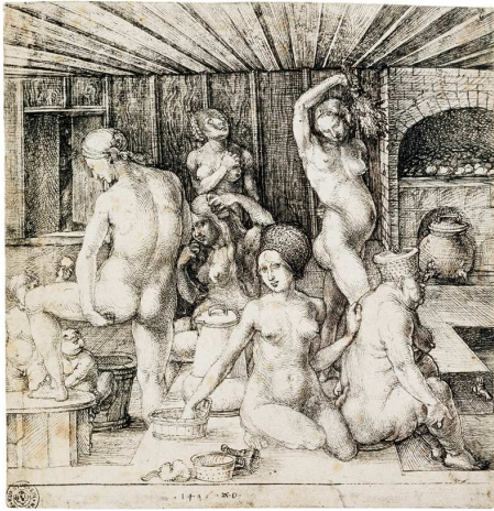
1) Frauenbad , 1496 Federzeichnung,

Anne-Marie Bonnet ALBRECHT DÜRER Die Erfindung des Aktes 160 Seiten, 77 Farbtafeln, 25 Abbildungen ISBN 978-3-8296-0651-6 €49.80, (A) €51.20, CHF 66.90