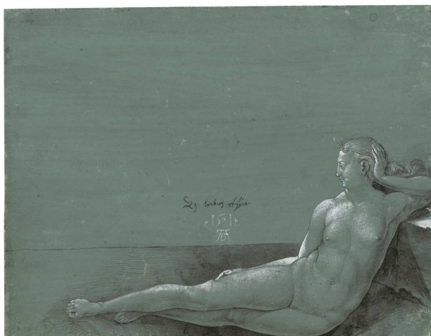
3) Liegende nackte Frau , 1501 Feder- und Pinselzeichnung, grau getuscht auf grünem Grund, weiß gehöht, Albertina, Wien