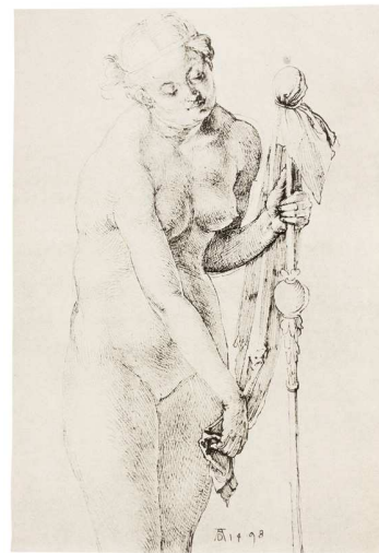
2) Nackte Frau mit Stab , 1498 Federzeichnung, Crocker Art Gallery, Sacramento