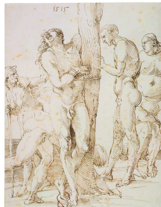
9) Sechs nackte Figuren, 1515 Federzeichnung, Städel Museum, Frankfurt a. M.