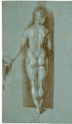
6) Weiblicher Rückenakt, 1506 Pinselfzeichnung auf blauem venezianischem Papier, weiß gehöht, Staatliche Museen zu Berlin/ SMPK, Kupferstichkabinett