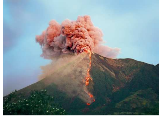
8) Jörg Sasse: 2613, 2005