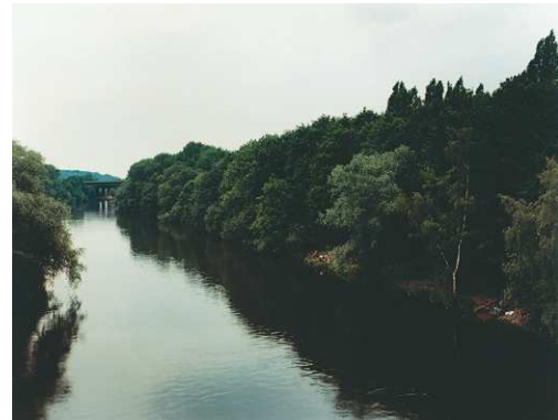
4) Andreas Gursky: Mühlheim a.d. Ruhr, Angler, 1989