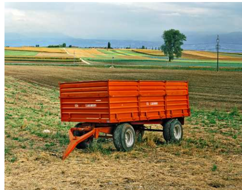
10) Ulrich Gambke: CH-Bussy-Chardonney, 2-9/91, 1991