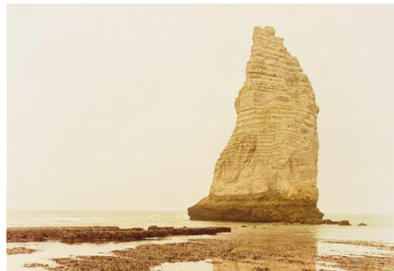
12) Elger Esser: Cap-Antifer-Étretat, la Roche d'Aval, Frankreich, 2000