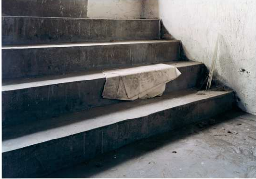
7) Laurenz Berges: Krefeld (#2571), 2007