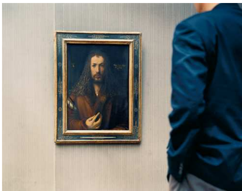
5) Thomas Struth: Alte Pinakothek. Selbstnortrait. München. 2000