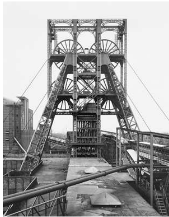
1) Bernd und Hilla Becher: Förderturm Beringen, Belgien, 1991

erscheint zur gleichnamigen Ausstellung in der Bayerischen Akademie der Künste, München 12. November 2009 bis 14. Februar 2010