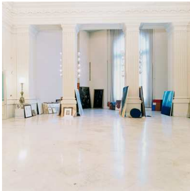
3) Candida Höfer: Banco de España IV, 2000