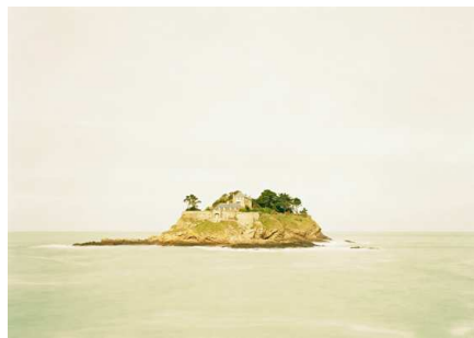
2) Île du Guesclin, Frankreich, 2003