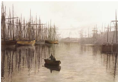
4) 73 Dunkerque, 2006