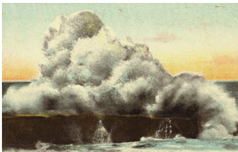
1) 4027 Biarritz, 2006