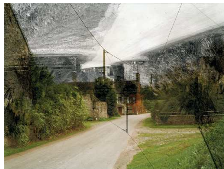
8) Combray (Urville), Frankreich, 2007