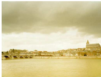
5) Blois I, Frankreich, 1998