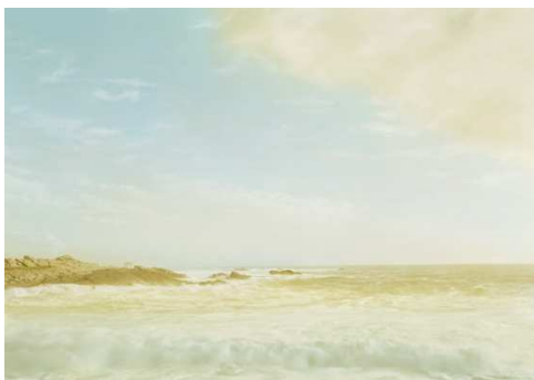
7) Beg er Lan, Frankreich, 2006