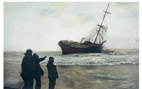
3) 20 Le Tréport, 2006