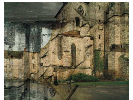
9) Combray (Orbais-l'Abbaye), Frankreich, 2007