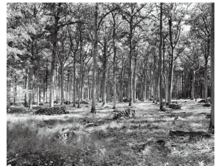
6) Combray (Arc-en-Barrois), Frankreich, 2007