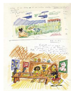
4) Traumzeichnungen von Fellini: der Cutter Leo Catozzo mit Helikoptern; das Ehepaar Fellini bei Picasso