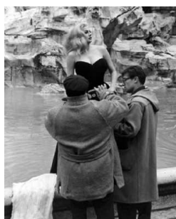
6) Anita Ekberg im Trevi-Brunnen bei den Dreharbeiten zu „La Dolce Vita“