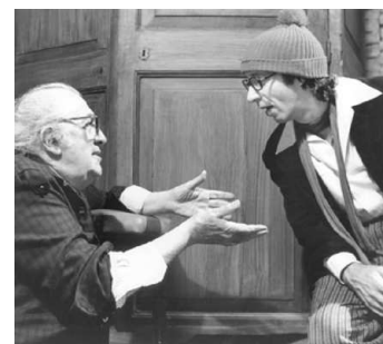
11) Federico Fellini erklärt am Set von „La Voce della Luna“ („Die Stimme des Mondes“) Roberto Benigni eine Szene