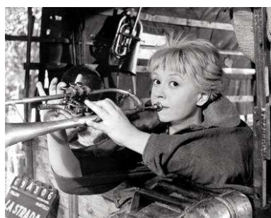
2) Giulietta Masina, die das berühmte Motiv aus „La Strada“ („Das Lied der Straße“) spielt