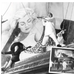
9) Peppinos Albtraum aus „Le Tentazioni del Dottor Antonio“ („Die Versuchung“)