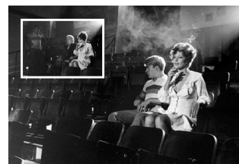
8) Während des Films („Amarcord“)