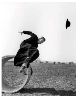
5) Richard Basehart („Picasso“), als Priester verkleidet in „Il Bidone“ („Die Gauner“)