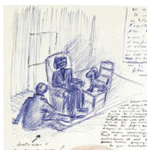
3) Traumzeichnung von Fellini, in der er Pasolini nach dessen Ermordung besucht