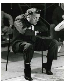
1) Fellini während der Dreharbeiten zu „Agenzia Matrimoniale“ („Eine Heiratsagentur“)

Das Buch der Filme 320 Seiten, mehr als 400 teils farbige Abbildungen Deutsch/Englische Ausgabe ISBN 978-3-8296-0423-9 Ladenpreis EUR 58,-; sFr 94,-