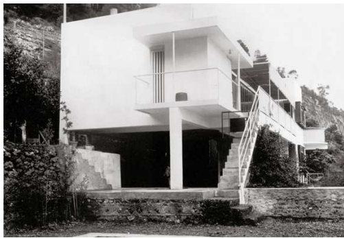
2) Das Haus E.1027, Ansicht der Westseite