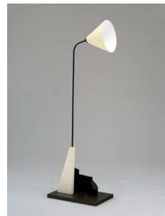
9) Stehlampe mit „kubistischem“ Fuß, 20er Jahre