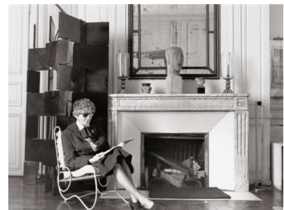
11) Eileen Gray in dem für Tempe à Pailla entworfenen Metallstuhl im Salon ihrer Wohnung, 1970