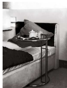
10) verstellbarer Beistelltisch „E.1027“, 1927-29