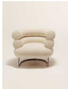
5) Moderner Nachbau des Bibendum-Stuhls, Edition ClassiCon