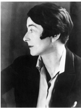
1) Eileen Gray, 1926, photographiert von Berenice Abbott