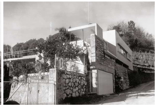
3) Das Haus Tempe à Pailla, Ansicht der Straßenfront