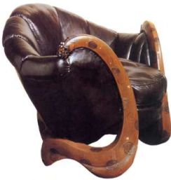
4) Serpent-Chair, ca.1917-19, ursprünglich in der Rue de Lota, später im Besitz von Yves Saint-Laurent