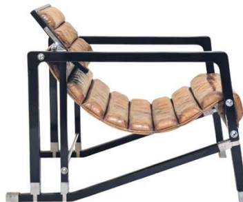
6) Transat-Stuhl, 1925-30