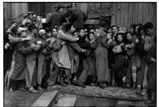
3) Shanghai, China, 1948