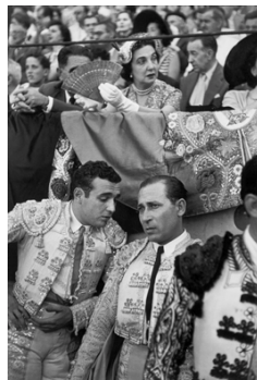
8) San Fermines, Pamplona, Spanien, 1952