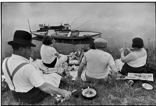
1) Juvisy-sur-Orge, Frankreich, 1938

Ladenpreis EUR 58.- ; sFr. 95.-; EUR (A) 59.70