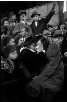
4) New York City, 1946