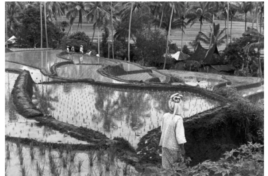
6) Sumatra, Indonesien, 1950