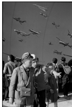
2) Weltausstellung, Brüssel, Belgien, 1958