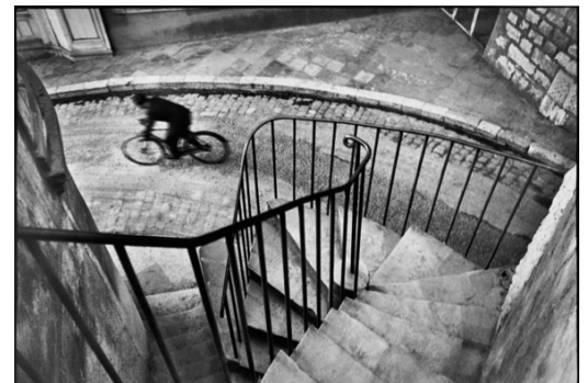
9) Hyères, Frankreich, 1932