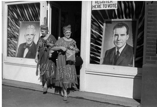
5) Texas, 1960