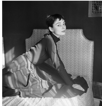
2) Audrey fotografiert von Cecil Beaton, März 1954