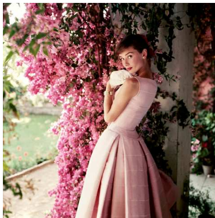
3) Audrey in Givenchy in der Villa Rolli, Cecchina, in der Nähe von Rom, während der Dreharbeiten zu Krieg und Frieden, Juni 1955.