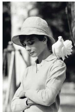
10) Am Drehort von Zwei auf gleichem Weg .