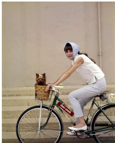
7) Audrey mit ihrem Hund Assam am Set von My Fair Lady . Foto: Cecil Beaton, 1963