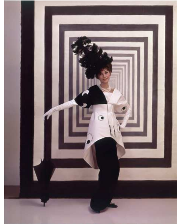
6) Audrey Hepburn in einem Kostüm von Cecil Beaton für My Fair Lady . Design und Foto: Cecil Beaton, 1963