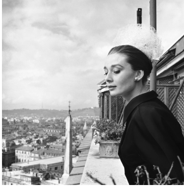
5) Im Hotel Hassler, Rom, Januar 1960.