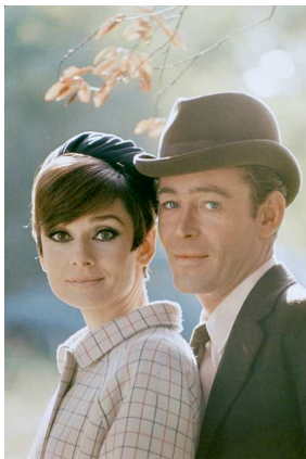
9) Audrey Hepburn mit Peter O'Toole. während der Dreharbeiten zu Wie klaut man eine Million? , veröffentlicht 1966