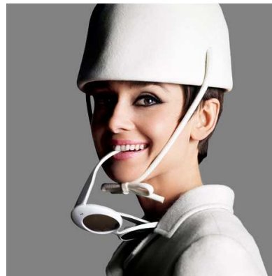
8) Audrey Hepburn in Givenchy und mit Sonnenbrille von Oliver Goldsmith. für Wie klaut man eine Million? , veröffentlicht 1966