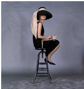
1. Publicity Shot

Howell Conant Audrey Hepburn in Frühstück bei Tiffany und andere Photographien Mit Texten von Leslie Caron und Deirdre Fernand 120 Seiten, 47 Farbtafeln Format 19,5 x 24 cm ISBN 978-3-8296-0294-5 € 19.80, sFr 34.30