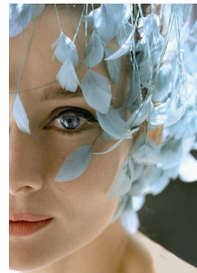
3. Großaufnahme ihrer berühmten Rehaugen