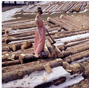
2. Modephotographie in den Schweizer Alpen