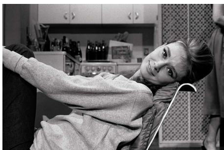
7. Während einer Drehpause