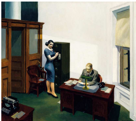
3) Office at Night , 1940