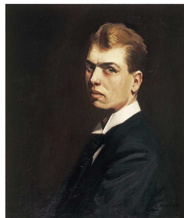
9) Selbstportrait , 1904