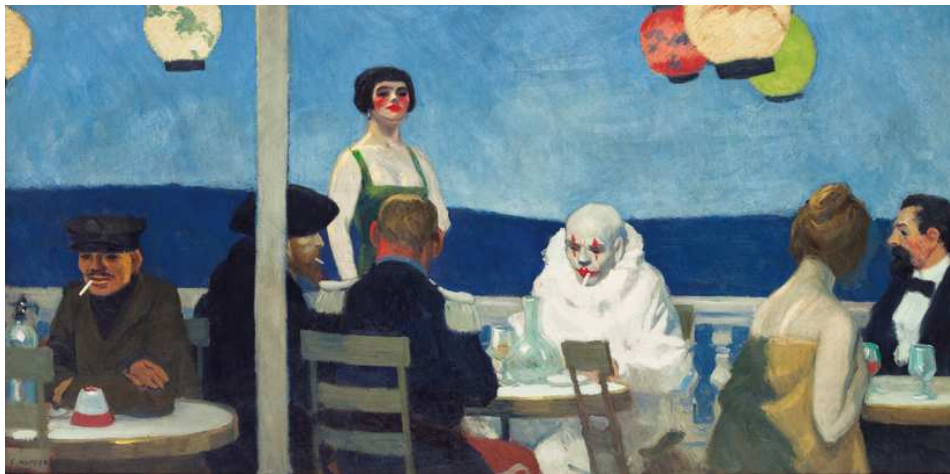
7) Soir bleu , 1914