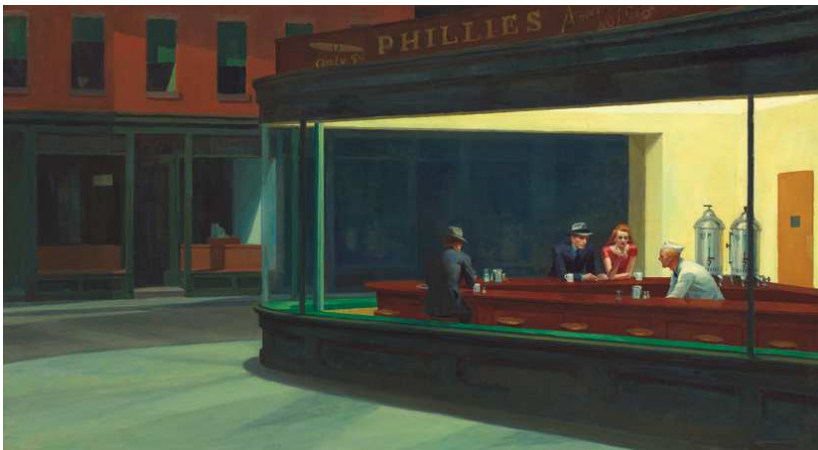
1) Nighthawks , 1942

Didier Ottinger EDWARD HOPPER Amerika - Licht und Schatten eines Mythos 128 Seiten, 100 teils farbige Abbildungen ISBN 978-3-8296-0634-9 €14.80, (A) €15.30, CHF 21.90