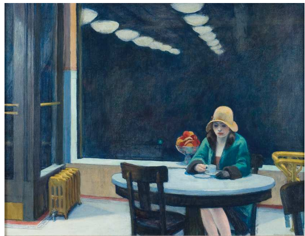
4) Automat , 1927