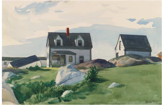
6) Gloucester, Maine , 1923 (Aquarell)