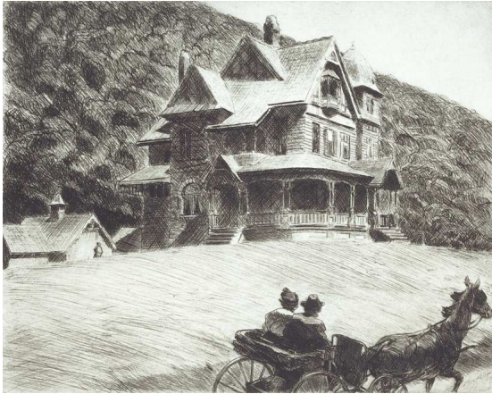
5) House on a Hill – The Buggy , 1920 (Radierung)