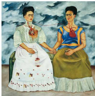
2) Die zwei Fridas, 1939