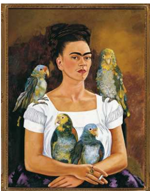
7) Ich und meine Papageien, 1941