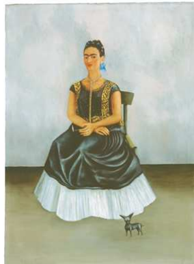
5) Selbstbildnis mit Itzcuintli-Hund, ca. 1938