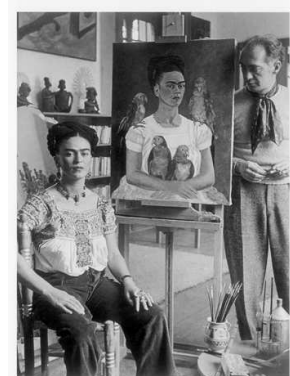
9) Frida Kahlo und Nickolas Muray im Blauen Haus in Coyoacán, 1941