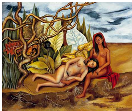
8) Zwei Akte im Wald oder Meine Amme und ich oder Die Erde selbst, 1939