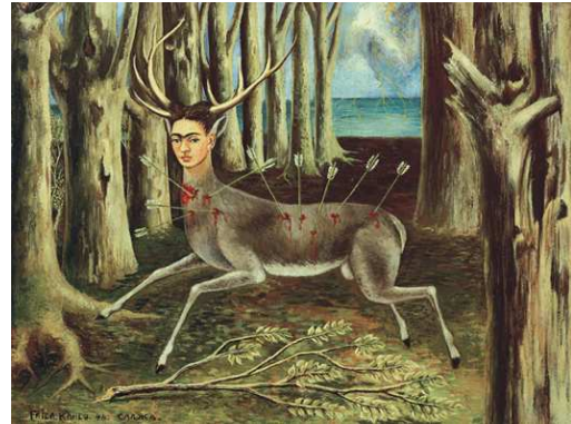
6) Der verwundete Hirsch, 1946