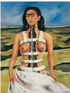
4) Die gebrochene Säule, 1944