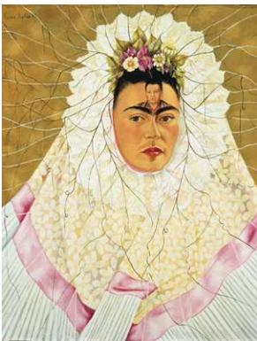
1) Selbstbildnis als Tehuana oder Diego in meinen Gedanken, 1943