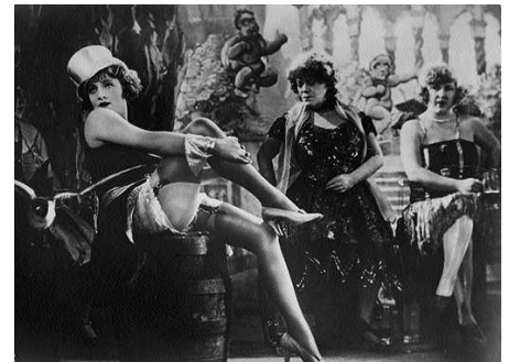
12) Marlene Dietrich, Rosa Valetti in „Der Blaue Engel“. Direction: Josef von Sternberg, 1930