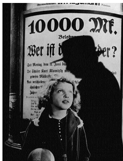
13) Inge Landgut as Elsie Beckmann in „M“. Direction: Fritz Lang, 1931