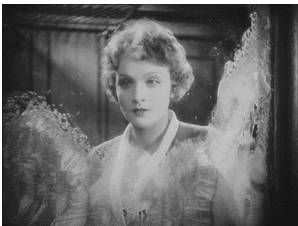
10) Marlene Dietrich as Stascha in „Die Frau, nach der man sich sehnt“. Direction: Kurt Bernhardt, 1929