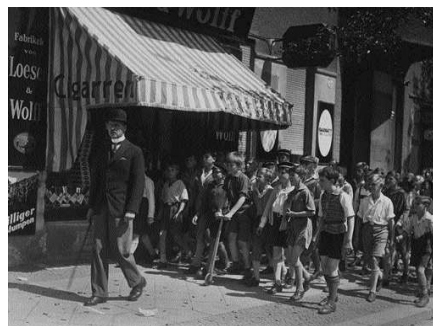
14) Fritz Rasp in „Emil und die Detektive“. Direction: Gerhard Lamprecht, 1931