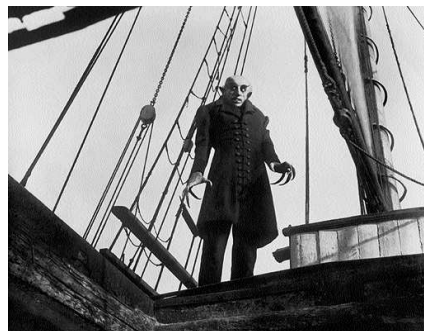
2) Max Schreck as „Nosferatu“. Direction: F.W. Murnau, 1922