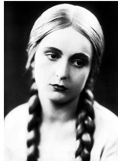
8) Camilla Horn as Gretchen in „Faust“. Direction: F.W. Murnau, 1926