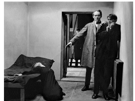
3) Gertrud Welcker, Bernhard Goetzke, Rudolf Klein-Rogge in „Dr. Mabuse“. Direction: Fritz Lang, 1922