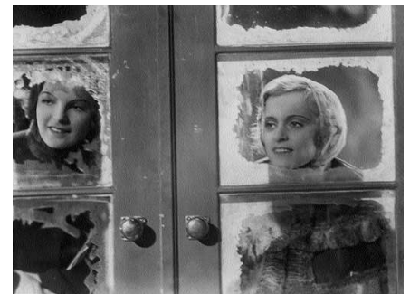
15) Magda Schneider, Luise Ullrich in „Liebelei“. Direction: Max Ophüls, 1933