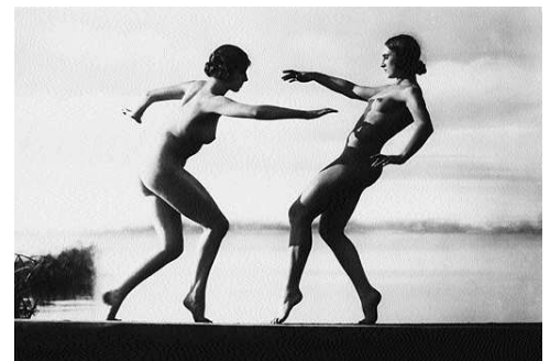
6) „Wege zu Kraft und Schönheit“. Direction: Wilhelm Prager, 1925