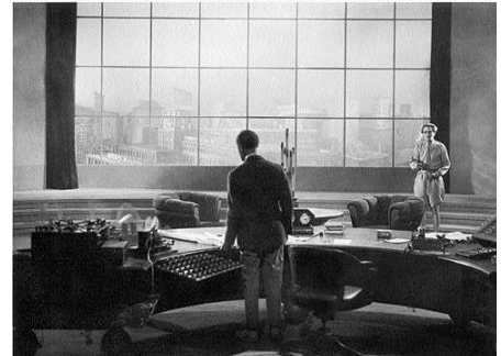
9) Alfred Abel, Gustav Fröhlich in „Metropolis“. Direction: Fritz Lang, 1927