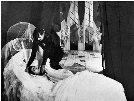
1) Lil Dagover, Conrad Veidt in „Das Cabinet des Dr. Caligari“. Direction: Robert Wiene, 1920