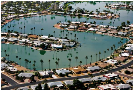
1) Sun City, Arizona