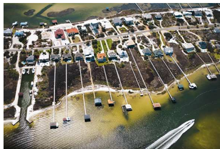
5) Ono Island, Alabama