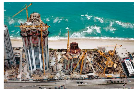
6) Sunny Isles, Florida