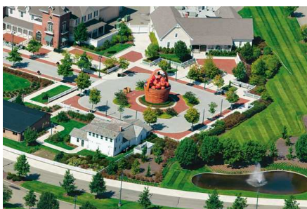
7) Frazeyburg, Ohio