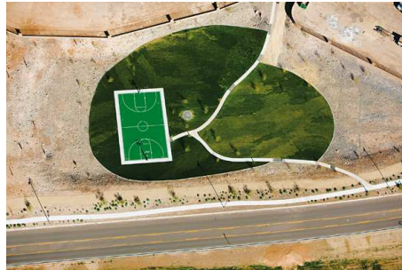
2) Anthem, Arizona