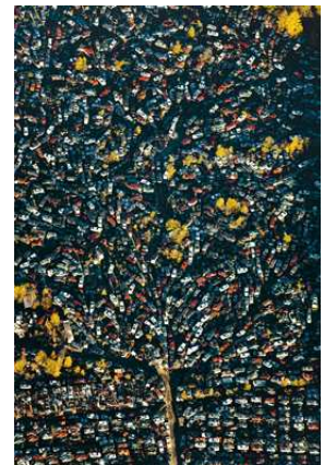
3) Ayer, Massachusetts