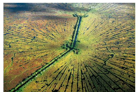
9) Maurepas, Louisiana