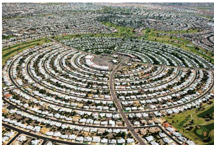
4) Sun City, Arizona