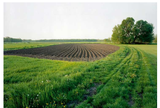
9) Kartoffelacker im Oderbruch, Neuhausen 2002