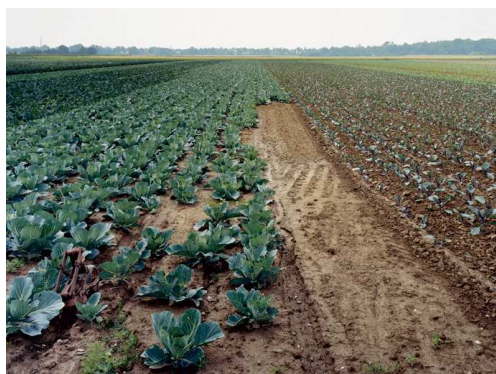
8) Junge Kohlfelder, Meerbusch-Büderich 2005