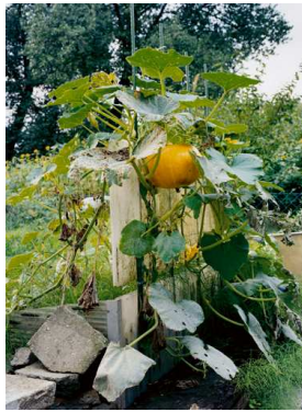
2) Kürbis, Düsseldorf-Niederkassel 2001