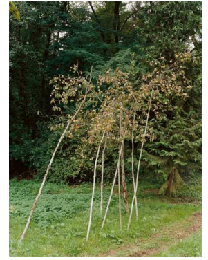
6) Pfirsichbaum mit Stützen, Montagney, Haute-Saône 2006