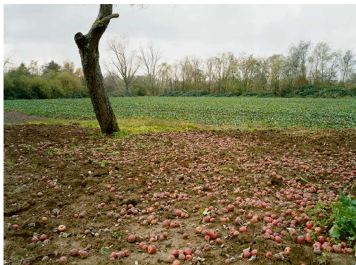
4) Apfelbaum, Dillingen, Saarland 2004