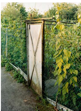
7) Tor im Bohnengarten, Duisburg 2001