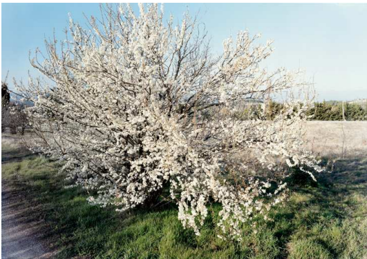
1) Blühender Weißdorn, Bonnieux, Vaucluse 2011