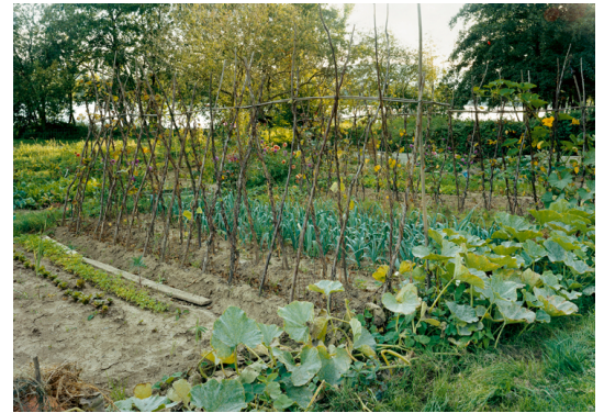
3) Gemüsegarten am See, Belfort 2004