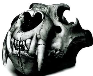
4) Lion Skull, Prague, 1986