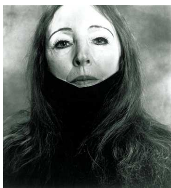
2) Anais Nin, New York, 1971