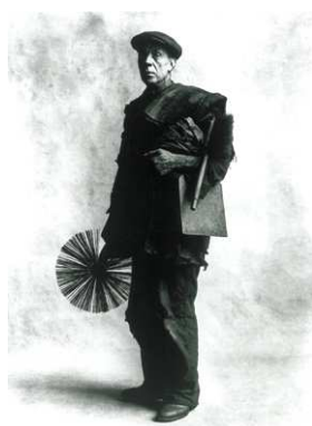
7) Chimney Sweep, London, 1950