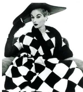
8) Harlequin Dress, (Fonsagrives-Penn), New York, 1950