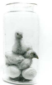
5) Chicks in a Jar, Mexico, 1942