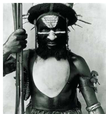
3) Tumbul Warrior, New Guinea, 1970