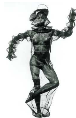
6) Young Woman in a Net (Miyake Design), New York, 1993