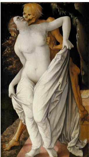
4) Hans Baldung Grien, Der Tod und die Frau, um 1518-1520