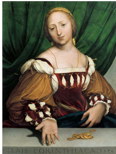
2) Hans Holbein, Lais Corinthiaca, 1526