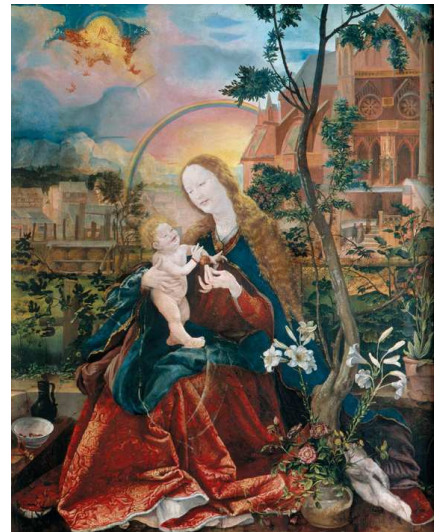
3) Matthias Grünewald, Die Stuppacher Madonna, 1519