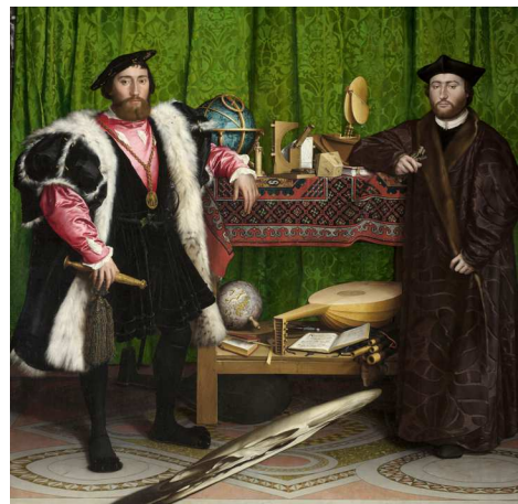
12) Hans Holbein d. J., Die Gesandten, 1533