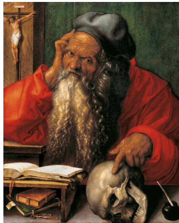
2) Albrecht Dürer, Heiliger Hieronymus, 1521