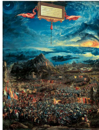
8) Albrecht Altdorfer, Die Alexanderschlacht, 1529