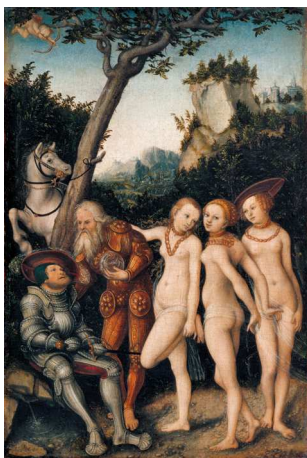
4) Lucas Cranach d. Ä., Das Parisurteil, 1530