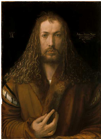
1) Albrecht Dürer, Selbstbildnis im Pelzrock, 1500

Anne-Marie Bonnet und Gabriele Kopp-Schmidt Die Malerei der deutschen Renaissance 408 Seiten, 307 farbige Abbildungen, davon 166 ganzseitige Tafeln verkleinerte Neuauflage ISBN 978-3-8296-0693-6 Ladenpreis €49.80, € (A) 51.20, CHF 66.90