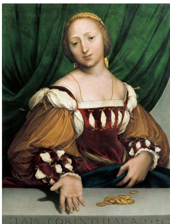
11) Hans Holbein d. J., Lais Corinthiaca, 1526