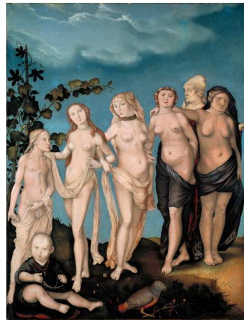
10) Hans Baldung Grien, Die sieben Lebensalter der Frau, 1544