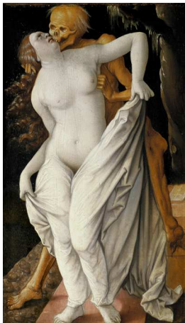
9) Hans Baldung Grien, Der Tod und die Frau, um 1518-1520