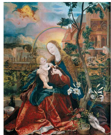
6) Mathis Grünewald, Stuppacher Madonna, 1519