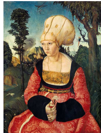
3) Lucas Cranach d. Ä., Bildnis der Anna Putsch, 1502/03