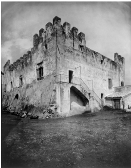
1) Aragonesische Burg in Villasor, Campidano