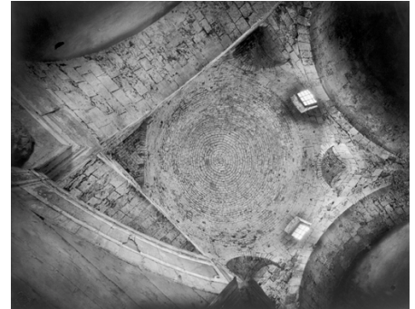
3) Cagliari, Santi Cosma e Damiano