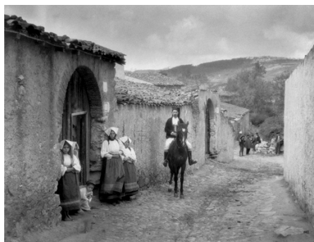
9) Straße in Atzara