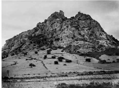
2) Die Burg von Acquafrèdda