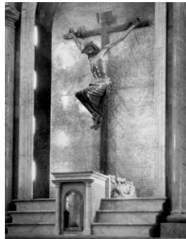
5) Kruzifix in San Francesco, Oristano