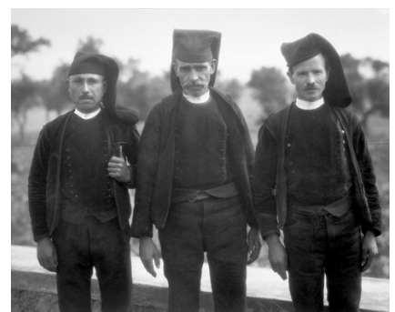
10) Sardische Bauern