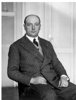
8) Der Maler Filippo Figari