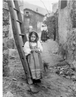
6) Sardisches Bauernkind