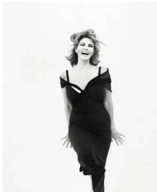
Raquel Welch, Hollywood 1993 1