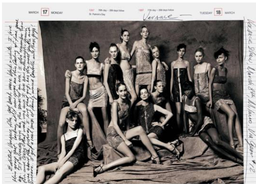
Versace Collection, Milan, March 1997 5