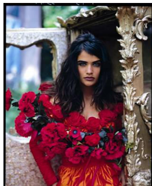
Helena Christensen, Leningrad 1990 9