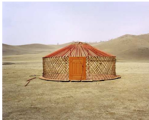
5) MN 050 Ger, 2004