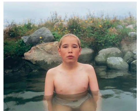
3) Isortoq Unartog #6, 1999