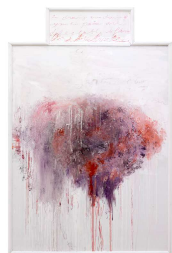
10) Analysis of the Rose as Sentimental Despair Part V , 1985