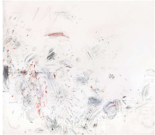
6) Hyperion (to Keats) , 1962