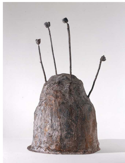
2) Thermopylae , 1992