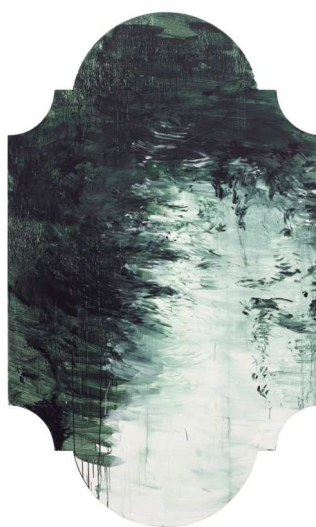
9) Untitled Part V , 1988