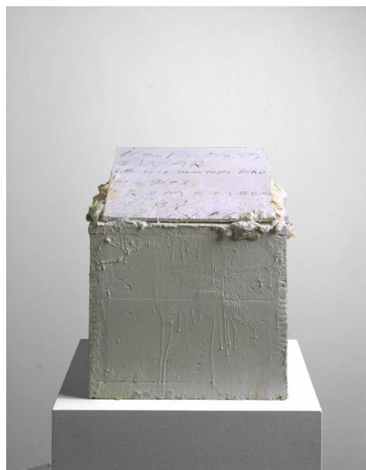
8) Epitaph , 1992