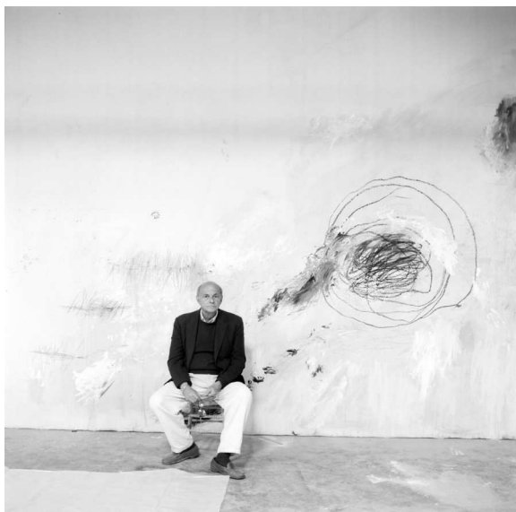
1) Cy Twombly