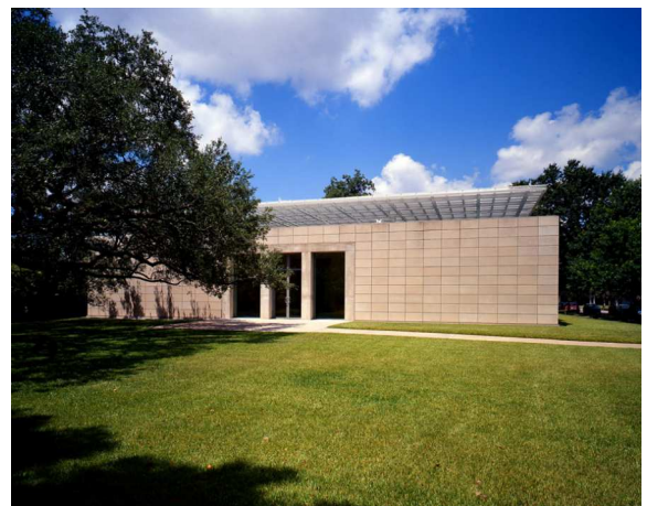
4) Cy Twombly Gallery: Eingangsbereich