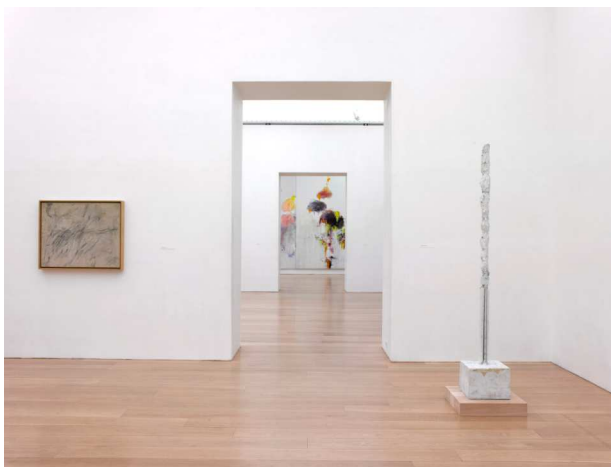
3) Cy Twombly Gallery: Blick durch die Ausstellungsräume