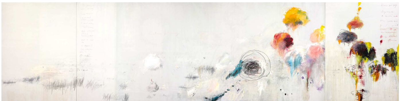
7) Untitled (Say Goodbye, Catullus, to the Shores of Asia Minor) , 1994