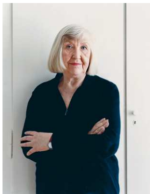
Hilla Becher, fotografiert von Laurenz Berges, Mai 2007