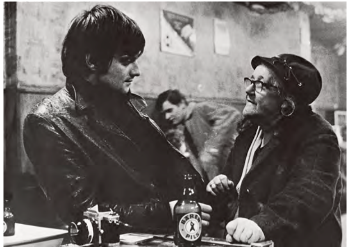
Anders Petersen im Café Lehmitz, 1970.

Mit einem Text von Roger Anderson Deutsch/englische Ausgabe 120 Seiten, 88 Duotone-Tafeln, gebunden ISBN 978-3-8296-0072-9 Ladenpreis € 29,80