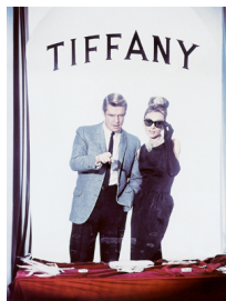
5) Audrey Hepburn und George Peppard beim Begutachten der Tiffany-Auslage. Film Still von 1960