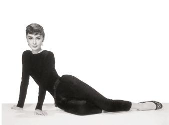
3) Publicity Aufnahme für „Sabrina“, 1954

Pamela Clarke Keogh Audrey Hepburn – Audrey Style 176 Seiten, 115 teils farbige Abbildungen € 39,80