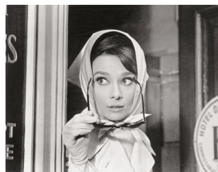
4) Audrey Hepburn in „Charade“