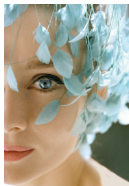
2) Großaufnahme ihrer berühmten Rehaugen