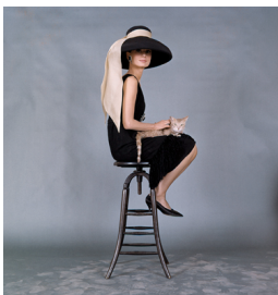
1) Publicity Aufnahme für „Frühstück bei Tiffany“

Howell Conant Audrey Hepburn in „Frühstück bei Tiffany“ 120 Seiten, 47 teils farbige Abbildungen € 19,80