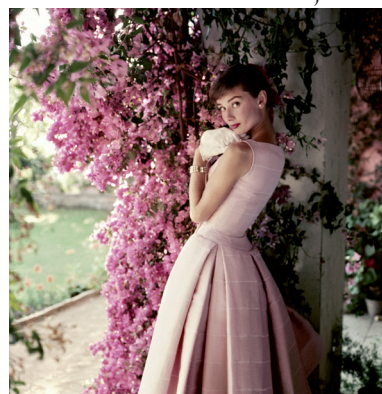
Audrey während Dreharbeiten, Juni 1955