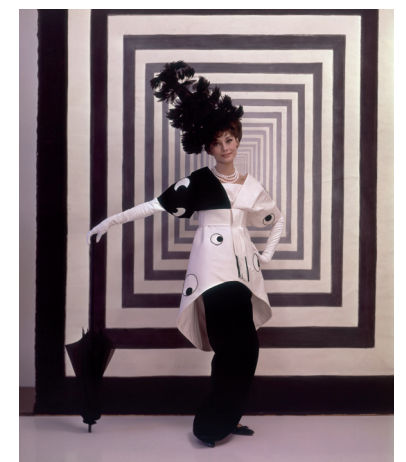
Audrey in einem Kostüm von Cecil Beaton, für My Fair Lady