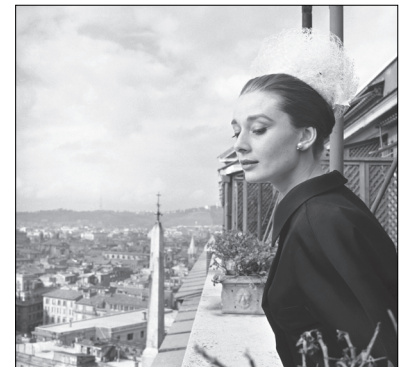
Im Hotel Hassler, Rom 1960