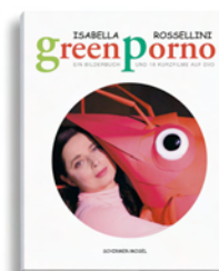
Isabella Rossellini Green Porno ISBN 978-3-8296-0441-3; € 29,80; sFr 49,-