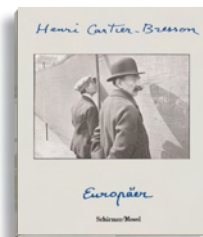
Henri Cartier-Bresson Europäer ISBN 978-3-8296-0419-2; € 39,80; sFr 65,-

Die Kunsthalle Erfurt zeigt vom 4. Oktober bis 29. November 2009 eine Ausstellung mit über 160 ausgewählten Photographien von Henri Cartier-Bresson zum Thema „Europäer“. Der gleichnamige Begleitband der Ausstellung (232 Seiten, 184 Duotone-Abbildungen, Lp. 39,80 €) erscheint bei Schirmer/Mosel. Rezensionsexemplare auf Anfrage.