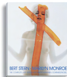
Bert Stern/Marilyn Monroe The Complete Last Sitting ISBN 978-3-88814-191-1; € 98,-; sFr 156,-

Am 3. Oktober 2009 feiert Bert Stern, der berühmte amerikanische Mode- und Monroe-Photograph, seinen 80. Geburtstag. Weltberühmt wurde er mit seiner Photoserie „The Last Sitting“ – dem letzten Shooting von Marilyn kurz vor ihrem plötzlichen Tod 1962. Sie ist in dem gleichnamigen großen Bildband zur Feier seines Geburtstags bei Schirmer/Mosel soeben in einer Neuauflage erschienen (464 Seiten, Lp. 98 €). Zur Illustration des Geburtstagsständchens für den großen Photographen stellen wir Ihnen gerne zwei Marilyn-Bilder aus dem Buch zur Verfügung (siehe www.schirmer-mosel.com unter „Pressemeldungen“).