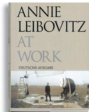
Annie Leibovitz At Work ISBN 978-3-8296-0382-9; € 46,-; sFr 75,-

Am 2. Oktober 2009 wird die große amerikanische Photographin Annie Leibovitz 60 Jahre alt. Für Gratulationen zum runden Geburtstag der großen „Promi-Dompteurin“, von der zuletzt die reich bebilderte Autobiographie „At Work“ bei Schirmer/Mosel (240 Seiten, Lp. 46 €) erschienen ist, stellen wir Ihnen gerne Bildmaterial zur Verfügung. Die große Ausstellung „A Photographer's Life 1990-2005“ von Annie Leibovitz eröffnet am 30. Oktober 2009 im Kunsthaus Wien und ist die letzte Station ihrer Europatournee (bis 31. Januar 2010).