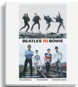
Beatles to Bowie The London 60's ISBN 978-3-8296-0381-2; € 46,-; sFr 75,-