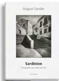
August Sander Sardinien ISBN 978-3-8296-0433-8; € 49,80; sFr 81,-

Rezensionsexemplare und Bildmaterial auf Anfrage.