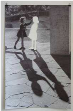
Zwei Mädchen Photo auf Karton 92 x 60 cm € 8.000,-