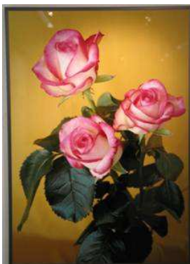
Nr. 13 (Rosen) C-Print, laminiert 120 x 170 cm, gerahmt