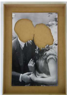
Liebespaar Photo in Kasten 50 x 36,8 x 5 cm € 10.000,-