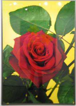
Nr. 11 (rote Rose) C-Print, laminiert 120 x 170 cm, gerahmt € 15.000,-

GALERIESTRASSE 2 · D-80539 MÜNCHEN TELEFON 089/29 16 16 01 · TELEFAX 089/29 16 16 02 VAT-ID No.: DE 129471598 E-Mail: showroom@schirmer-mosel.com