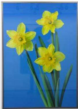
Nr. 14 (Osterglocken) C-Print, laminiert 120 x 170 cm, gerahmt