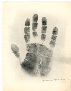
Antoine de Saint Exupery