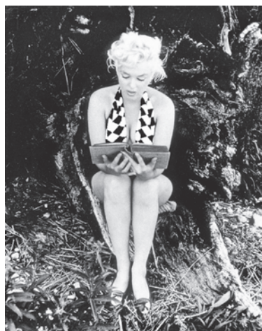
3.) Marilyn Monroe liest Ulysses von James Joyce, Long Island, 1955