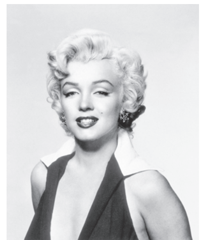
4.) Vorlage für Marilyn-Silkscreens von Andy Warhol, 1953