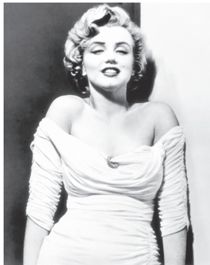
2.) "Life" Cover, 7. April 1952, Photo Philippe Halsman