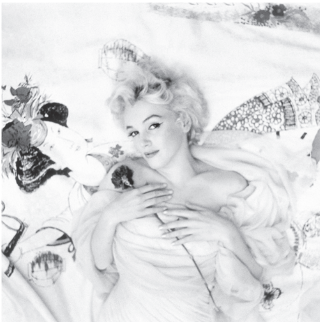
7.) New York, 1956, Photo Cecil Beaton