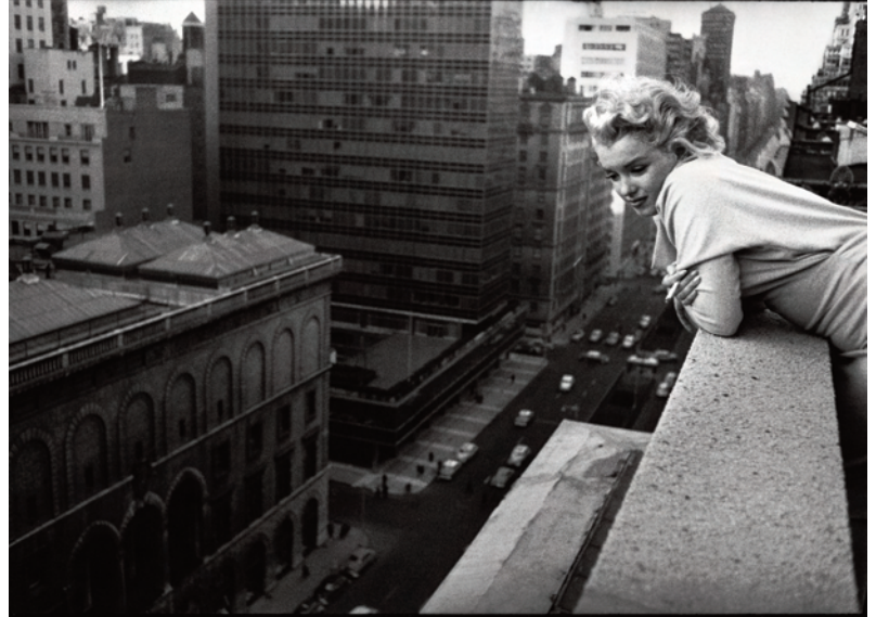
6.) New York, 1955