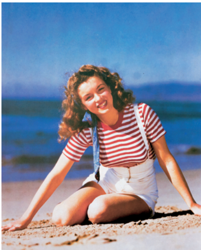
1.) Malibu, 1945

Marilyn Monroe Ein wunderschönes Kind 48 Photographien von Eve Arnold bis Weegee 1945-1962 Mit dem Essay von Truman Capote 120 Seiten, 48 Tafeln in Farbe und Duotone ViBi Magnum, broschiert ISBN 978-3-8296-1047-9 Lp. € 14,80 € (Ö) 15,30 CHF 17,-