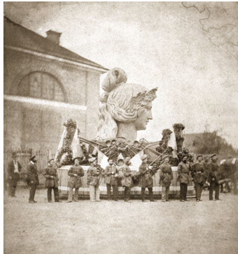
2) Kopf der Bavaria, vorbereitet für den Transport zur Theresienwiese, 7. August 1850.