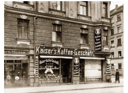
17) Kaiser's Kaffee-Geschäft in der Türkenstraße, Ecke Schellingstraße, um 1910.