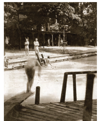
12) Das Wöstermayr-Bad, Ecke Müllerstraße/Hans-Sachs-Straße, 1890. 1895 wurde das Bad aufgelassen.