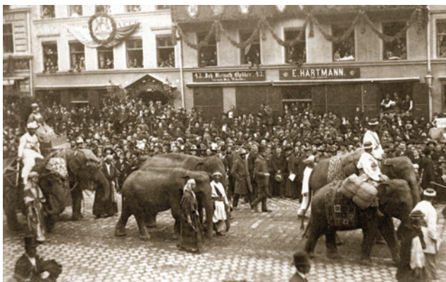
10) Die Elefanten der Kaufmannsgruppe im Festzug zur Centenarfeier 1888.