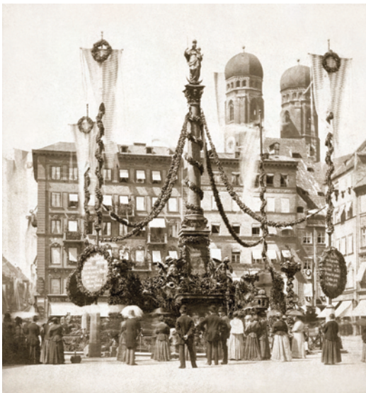
8) Die Mariensäule, festlich geschmückt anlässlich des Wittelsbacher Jubiläumsjahres, 25. August 1880.