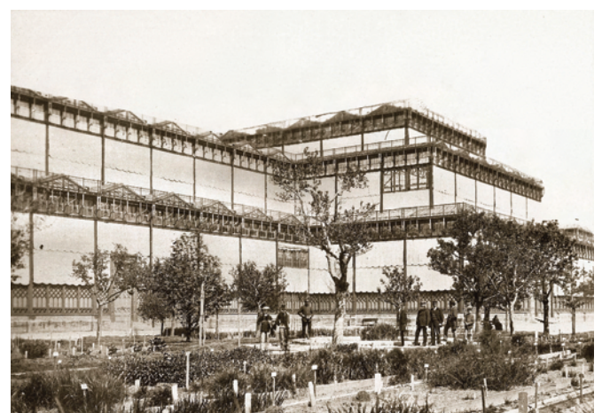
5) Besucher im Botanischen Garten an der Eisenstraße, dahinter der 1854 erbaute Münchner Glaspalast, um 1860.