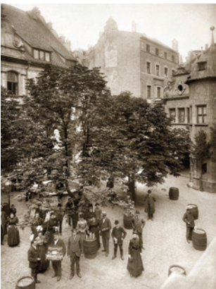
18) Im Hof des Hofbräuhauses, um 1910.