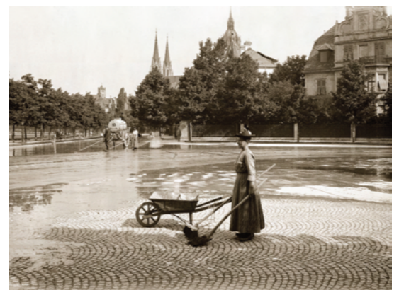
20) Straßenkehrerin am Bavariaring, Ecke Uhlandstraße. Im Hintergrund die Sankt-Pauls-Kirche, 1914.