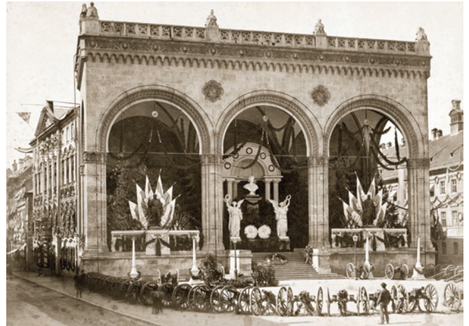
7) Die Feldherrnhalle am Odeonsplatz im Festschmuck anlässlich des Siegeszugs der Bayerischen Truppen nach dem Deutsch-Französischen Krieg, 16. Juli 1871.