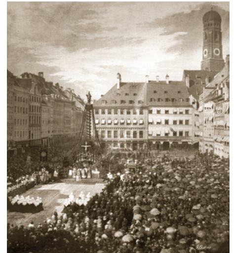
3) Dankgottesdienst an der Mariensäule für die Befreiung von der Cholera, 3. Oktober 1854.