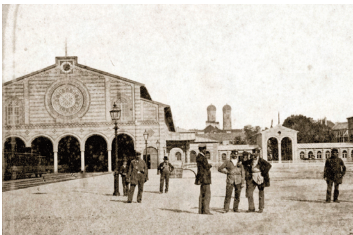
4) Der alte Münchner Hauptbahnhof. Blick von Westen zur Altstadt mit den Türmen der Frauenkirche, um 1860.