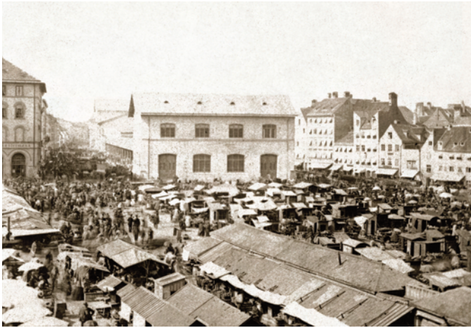
6) Marktgeschehen auf dem Viktualienmarkt, im Hintergrund die Schrammehalle, um 1865