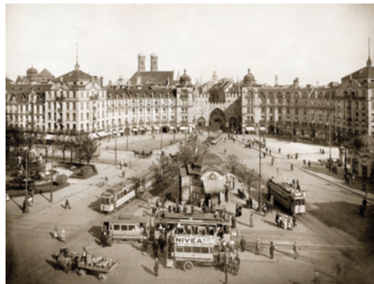
19) Die Ostseite des Karlsplatzes mit dem nach Plänen Gabriel von Seidl's 1899 bis 1902 neubarock gestalteten Rondell, 1913.