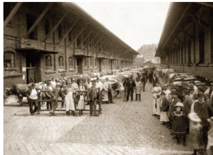
16) Die Großviehmarkthallen im Schlacht- und Viehhof, um 1905.