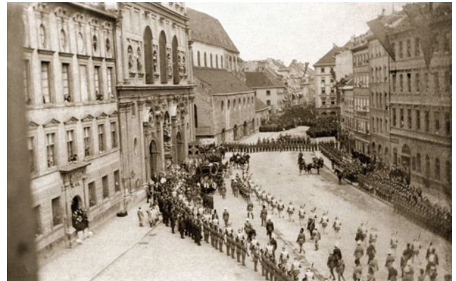
9) Trauerzug für König Ludwig II. am 19. Juni 1886. Ankunft des Leichenwagens vor der Sankt-Michaels-Kirche in der Neuhauser Straße.