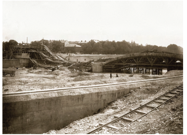
14) Beim Bau der Corneliusbrücke über die Isar stürzte am 26. August 1902 einer der Brückenbogen ein.