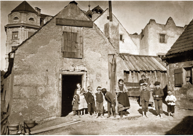
13) Kinder vor einem Vorstadthaus an der heutigen Reitmorstraße, 1895.