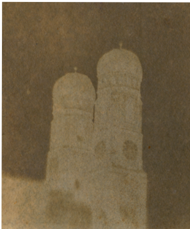
1) Die Türme der Münchner Frauenkirche, 1. August 1837

ELISABETH ANGERMAIR MÜNCHEN IM 19. JAHRHUNDERT Frühe Photographien 1850-1914 Herausgegeben vom Stadtarchiv München Mit einer Einleitung von Daniel Baumann 320 Seiten, 279 Abbildungen, ISBN 978-3-8296-1027-8 € 49,80 € (Ö) 51,20 CHF 57,30