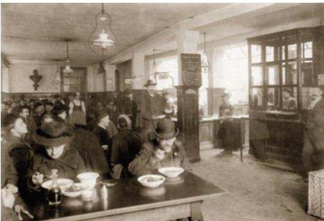
15) Öffentliche Speisehalle für Bedürftige in der Hotterstraße, 1904.