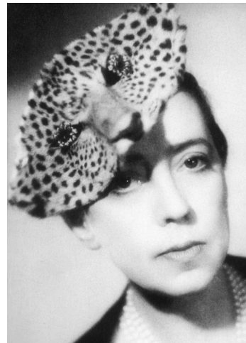
Elsa Schiaparelli, undatiert S. 145