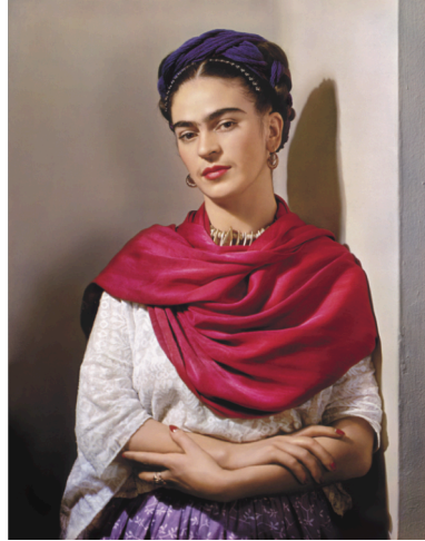
Frida Kahlo, New York 1939 S. 23