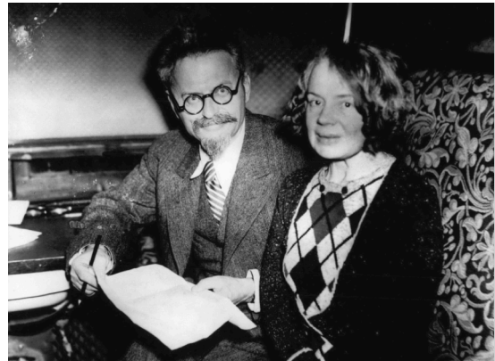
Leo Trotzki mit Ehefrau Natalja Sedowa, 1930er Jahre S. 31