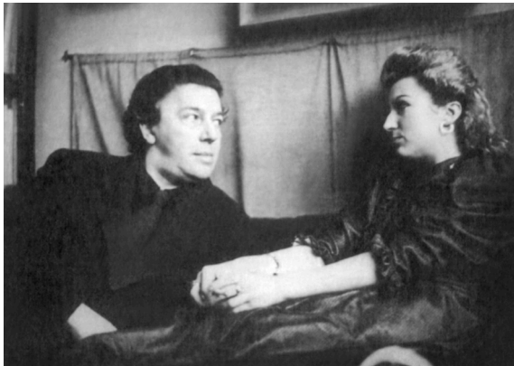
André Breton und Jaqueline Lambda, Paris, ca. 1938 S. 53