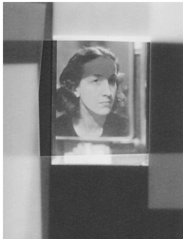
Marie-Laure de Noailles, 1938 S. 92