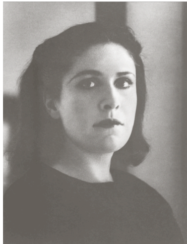
Dora Maar, 1937 S. 24