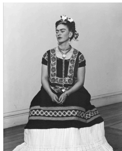
Frida Kahlo, Paris 1939 S. 177